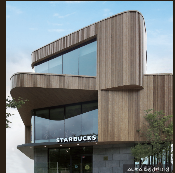
스타벅스 화명강변 DT점